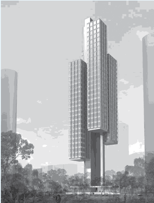
هتل معالی (سنگاپور)

این شهر - کشور چندملیتی در منطقه جنوب شرقی آسیا