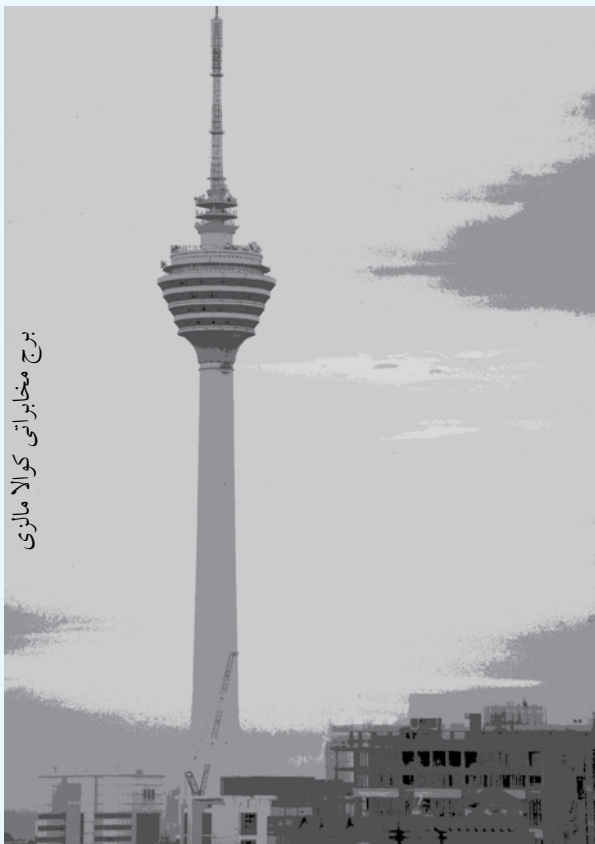
برج مخابراتی کوالا مالزی

نمونه‌هایی از قبیل چترهای زیبای نقاشی شده، چوب‌های کنده‌کاری شده، ظروف سفالی، سرامیک پنج رنگ، ظروف نقره‌کار، ظروف غذاخوری، منسوجات دستی، آثار حصیری و