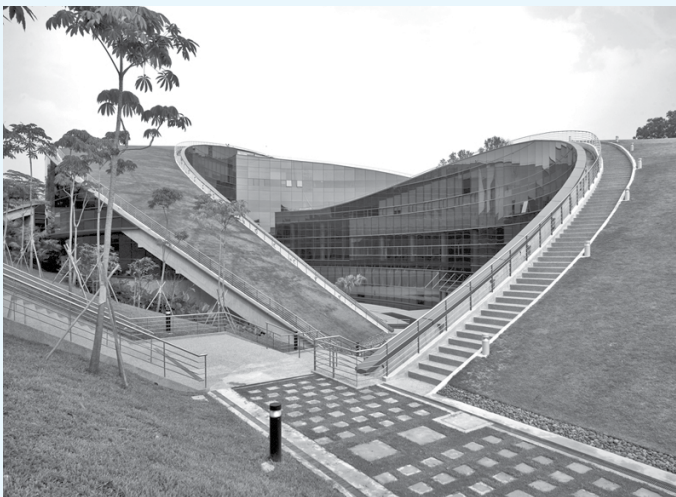
ساختمان مدرسه هنر سنگاپور

جایگاهی خاص و ویژه دارند. محلهٔ چینی‌ها و هندی‌ها و عرب‌ها در سنگاپور از مراکز مهم جذب جهانگرد و گردشگر است. ساختمان‌های این محله‌ها با استفاده از رنگ‌های شاد، زیبا و متنوع رنگ‌آمیزی شده‌اند و در این محله‌ها می‌توان نمونه‌ای کوچک از موقعیت تجاری و اقتصادی آن کشورها را مشاهده کرد. مواردی از قبیل فروشگاه‌های مواد غذایی، رستوران‌ها، صنایع دستی و مصنوعات رایج در کشورها، با سبک خاص و منحصر به فرد خود، تصویر یک کشور مستقل را به نمایش گذاشته‌اند. در محلهٔ هندی‌ها نمونهٔ بسیار دقیقی از سبک معماری و طراحی کشور هند دیده می‌شود و محلهٔ عرب‌ها نیز مقیاسی کوچک از تنوع، گوناگونی و وضعیت کشورهای عربی است. گل ارکیده نیز یکی از نمادهای کشور سنگاپور است. آن‌ها با احداث باغی ویژه برای پرورش این گل زیبا، انواع گل‌های ارکیده را در رنگ‌های مختلف پرورش می‌دهند. در این باغ، نام گونه و خصوصیات هر گل روی لوح‌هایی حک شده است.