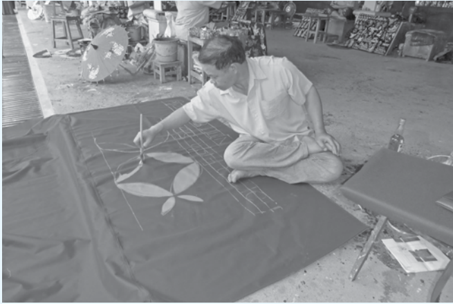
برش و ساخت چتر در دهکده ای در تایلند