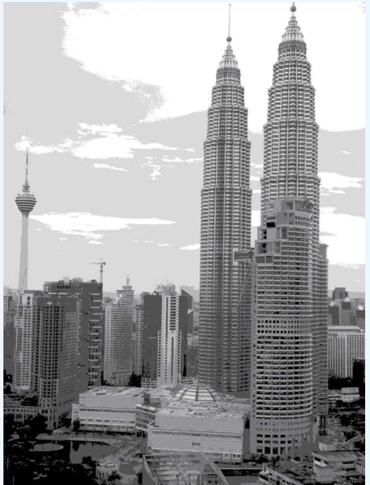
برج های معروف دوقلوی مالزی

مالزی امروز مقصد مسافران بی‌شماری از سراسر جهان